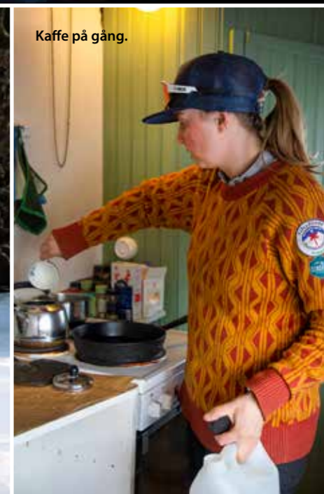
Kaffe på gång.