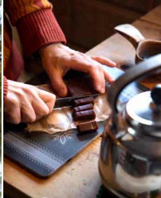
Sofies syster är hantverksbagare och gör egen chokladkola – till glädje för Sofie.